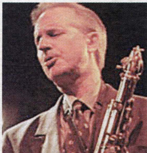
Scott Hamilton è il protagonista della serata di chiusura

gliana. Come tradizione vuole, al termine dei concerti le jam, nel cortile della sala consiliare in piazza Conte Rosso.