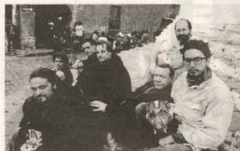
Da sinistra, Tiziano Ferro, che apre Asti Musica sabato 3; Patti Pravo, che si esibirà sabato 10; Carmen Consoli, ultima dei big, sul palco sabato 17; Modena City Ramblers, in programma lunedì 12